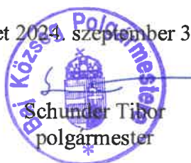
Schunder Tibor polgármester

Ez a rendelet 2024. szeptember 30-án lép hatályba.